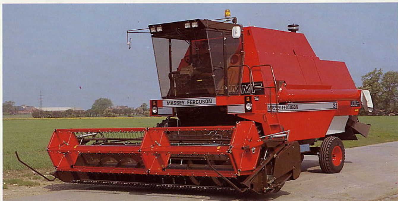
Het grootste type MF 31