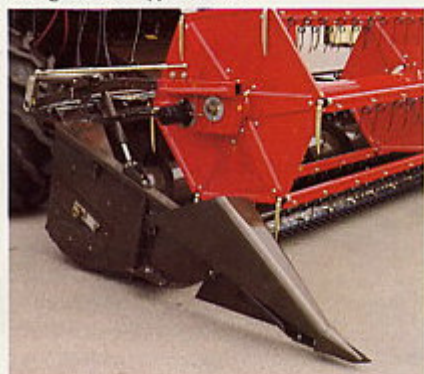
Maaibord met grote capaciteit

Uitgekiende werkwijze en vormgeving, uiterst betrouwbaar, onvergelykbare capaciteit en aantoonbaar schoner graan. Dat zijn enkele van de meest kenmerkende pluspunten van de nieuwe serie MF combines.